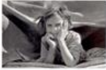
Harper Lee Ne tirez pas sur l'oiseau moqueur